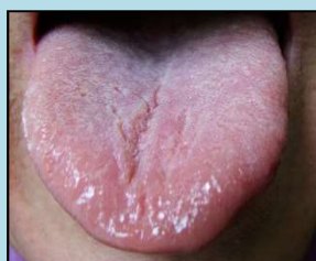
fialový střed (oblast ST), lehce nateklý, lepivý povlak, ST rýha

Rozdíly oproti klasickému předchůdci: ● ošetřuje duševní aspekt stagnace čchi ● více bylin na trávení